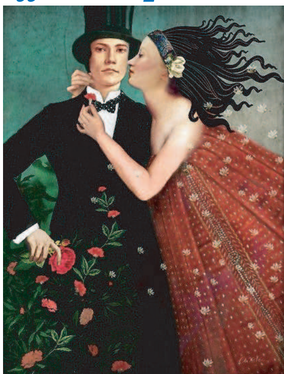
immagine di Catrin Welz-Stein "The Art of seduction"

la dipendenza affettiva, quando amare fa soffrire